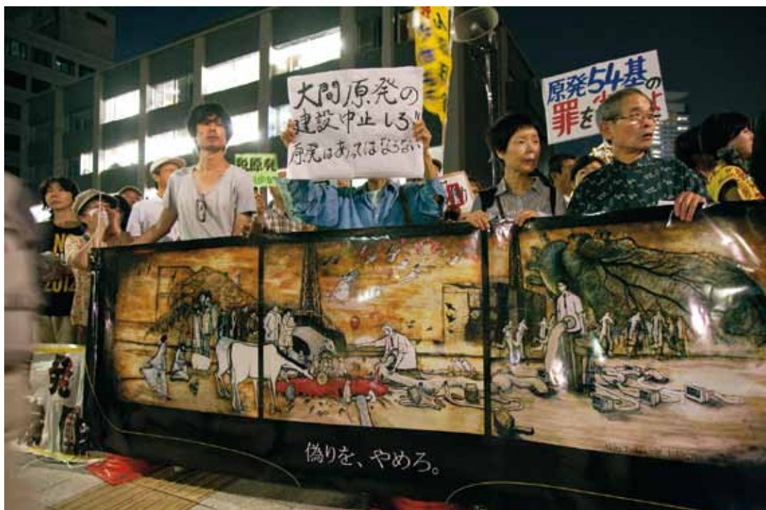
運動の力に確信を持って（昨年の再稼働反対・首相官邸前行動。撮影＝五味明憲）

裏切られていくこととなります。その点では維新も、自民や公明と同様、深刻なジレンマの中にあると言っていいでしよう。