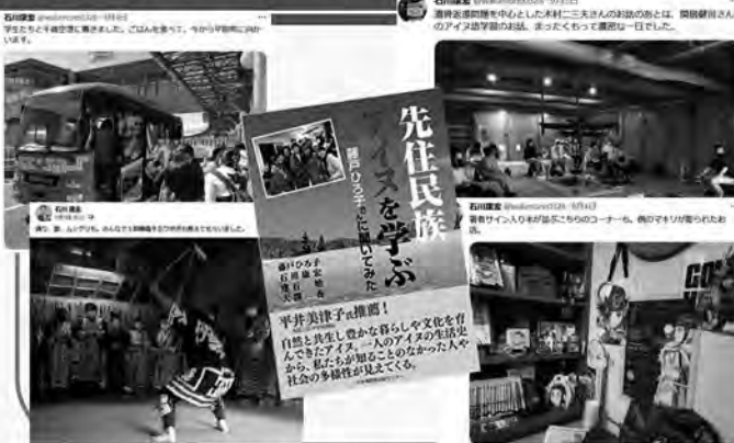
アイヌの先住権、すべての個人の尊厳を守る政治を